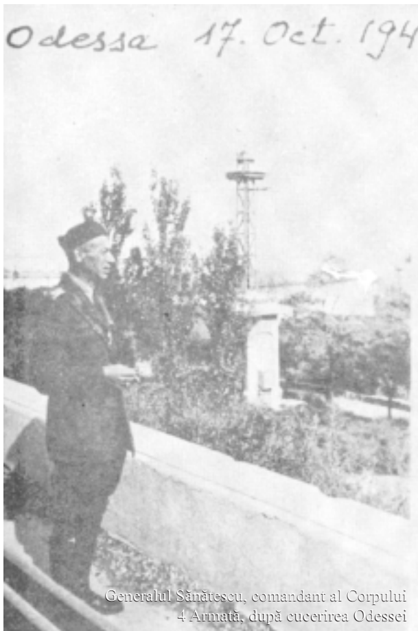
Generalul Sănătescu, comandant al Corpului 4 Armată, după cucerirea Odesei

Campania spre est și dezastrul militar de la cotul Donului. Actul de la 23 august 1944, culminând cu ultima întâlnire dintre regele Mihai și Mareșalul Antonescu. Treptele procesului de sovietizare a României din anii 1944-1947. Generalul era perfect conștient de faptul că relatarea unor asemenea evenimente, la care participase nemijlocit, vor transforma Jurnalul său într-un document militar, istoric și politic de primă mărime.