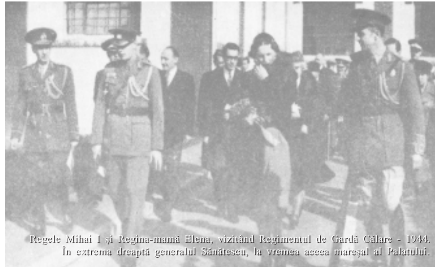
Regele Mihai I și Regina-mamă Elena, vizitând Regimentul de Gardă Călare - 1944. În extrema dreaptă generalul Sănătescu, la vremea aceea mareșal al Palatului.

— Vom încerca să rezistăm pe frontul fortificat Focșani—Oancea—Belgrad, zice Mareșalul