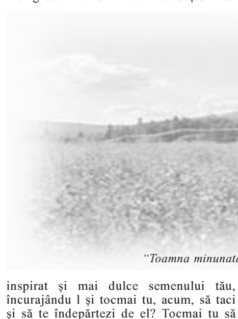
"Toamna minunată a tuturor rodurilor"

De ce n ai crede în tine și în noroc și în clipa dumnezeiască ce te va proiecta, fără să știi, cum în ținutul fericit al unor izbânzi imediate sau viitoare? Nimeni nu poate înfrunta ca tine greul și, atunci, tocmai tu să fii cel care să te temi de el? De greu? Nimeni nu-i vorbește mai