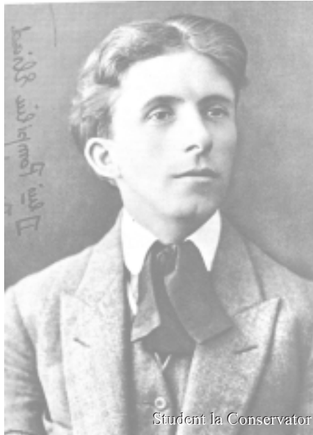
Student la Conservator

M-am născut la Breaza, pe Valca Prahovei, sat vestit prin hărnicia oamenilor, prin deosebita măiestrie a fetelor în migăloasele cusături românești, prin florile cântecele și jocurile țărănești care i-au creat faima.