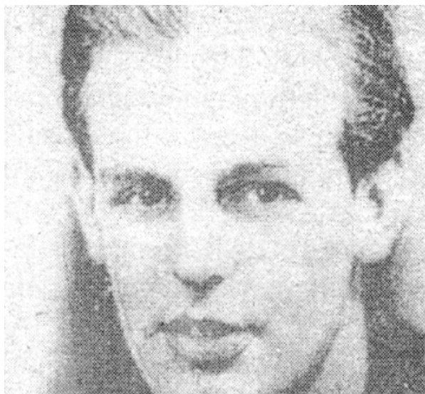
Donald MacLean, studentul din Cambridge, diplomatul de mai tâziu

Donald MacLean, angajatul ambasadei britanice din Washington, a primit misiunea să elucideze cazul. Spionul sovietic nu putea găsi un loc mai bun pentru îndeplinirea scopului său, decât Washington-ul. Ajunși aici, el își face intrarea în viața socială, făcând cunoștință cu principalii conducători ai diplomației americane și cu politicienii, lucru care îl ajută să ajungă la anumite informații secrete, pe care le transmite imediat oamenilor lui Stalin. În fața lui MacLean se deschid toate ușile, pentru că el e principalul reprezentant al celui mai important aliat al Americii. Într-un interval foarte scurt de timp, el reușește