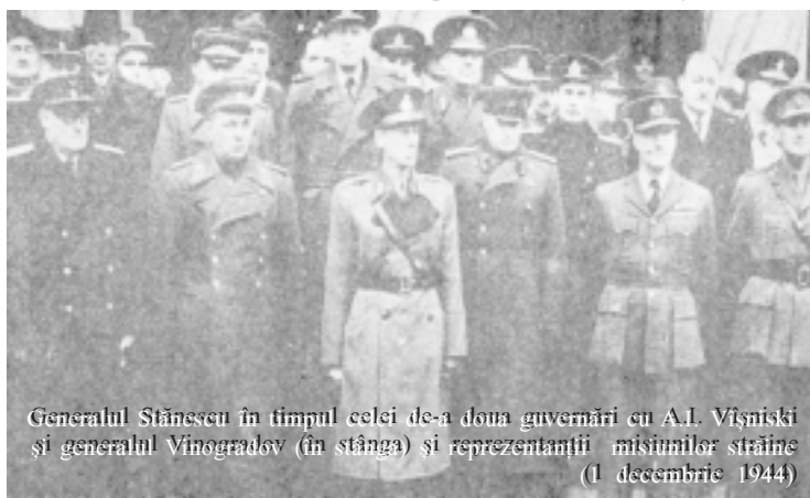
Generalul Sănătescu în timpul celei de-a doua guvernări cu A.I. Vișnișki și generalul Vinogradov (în stânga) și reprezentanții misiunilor străine (1 decembrie 1944)

La ora 22, Majestatea Sa Regele a citit la radio Proclamația.